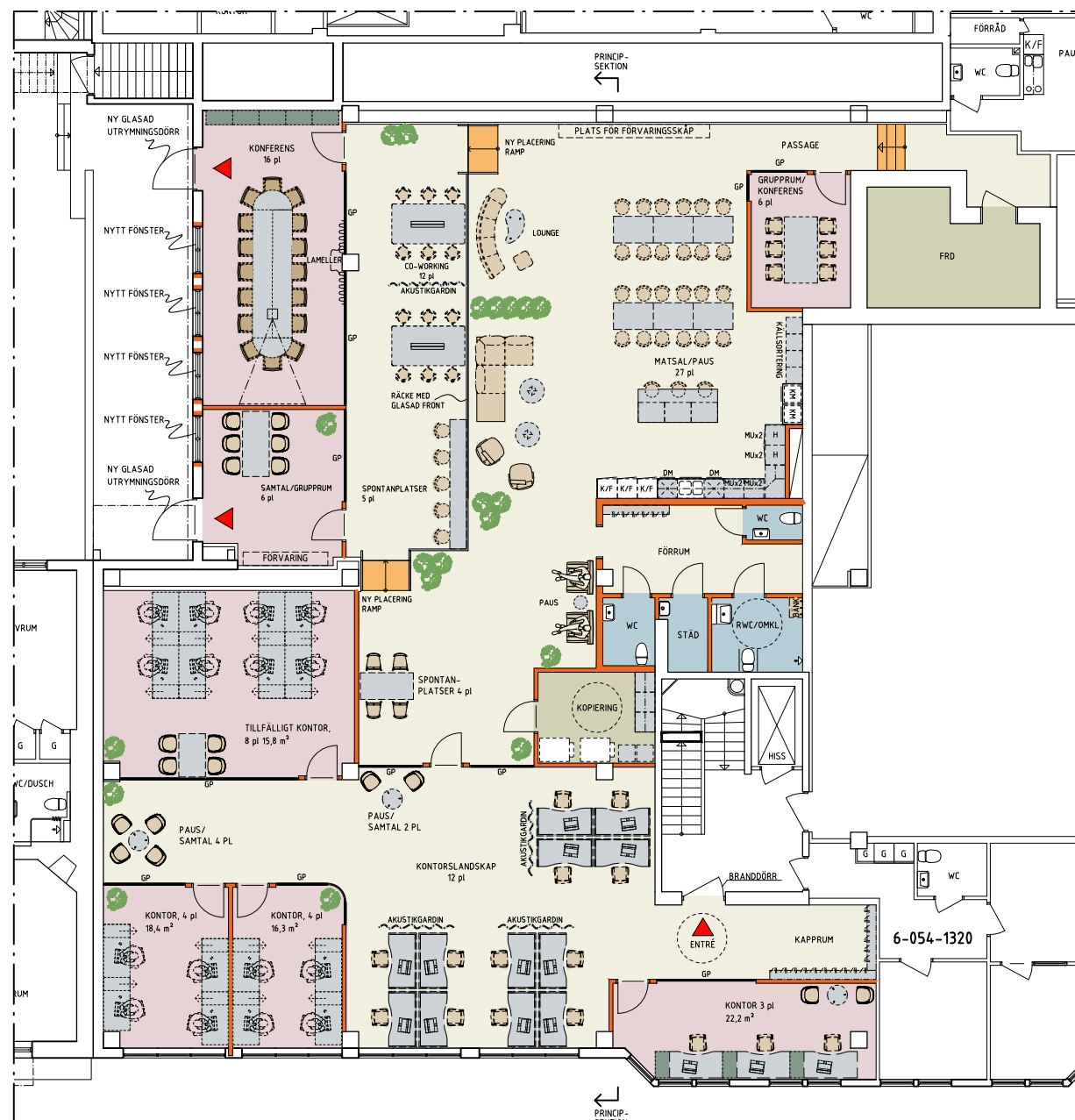
DEL AV PLAN 3